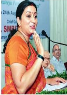
హైదరాబాద్లో కేకేఎం మెమోరియల్ ఎడ్యుకేషనల్ సొసైటీ ఆధ్వర్యంలో నిర్వహించిన కార్యక్రమంలో ప్రసంగిస్తున్న కేంద్ర మంత్రి స్మృతి ఇరానీ

ప్రతిదీ గూగుల్లో వెతుకుతున్న నవతరం.. మన సంస్కృతి, మన ప్రపంచానికి అందించిన మేధావులు, వారి మనశలను గురించి కూడా తెలుసుకోవాలని కేంద్ర మానవవనరుల శాఖ మంత్రి స్మృతి ఇరానీ పిలుపునిచ్చారు. హైదరాబాద్లోని కేకేఎం మెమోరియల్ విద్యాసంస్థల 10 వేల మంది అధ్యాపకములతో జాగ్రత్త అధికారం నిర్వహించిన సవస్థలో భాగంగా విలువలతో.. విద్యార్థులకు ప్రాధాన్యత ఇవ్వాలని ఆమె అన్నారు. 'ఉపాధ్యాయులు కేవలం పాఠం చెబుతారు. ప్రశ్నలకు సమాధానమిస్తారు. కానీ గురువులు చదువులోపాలు చేయించారన్న ఆందోళన.. ప్రశ్నించే తప్పిస్తారు. సమాధానాన్ని వెతికి జిజ్ఞాస పెంచుతారు. అందుకే మనకు ఉపాధ్యాయులు కాదు.. జీవితాన్వయించే గురువులు కావాలి. మన సంస్కృతిలోని గురుశిష్య పరంపర కావాలి' అన్నారు. 'గతంలో ఎంతగా అభివృద్ధి చెందినా ఇప్పటికీ మన అభ్యుదయ రూపొందించిన అధికారం ఉపయోగించలేకపోయాం. అయిన గోపాధ్యాన్ని ఈ తరం ఎప్పుడు గుర్తుకుంది? పింగళివెంకయ్య ఎవరో ఎవరికి తెలుసు? పోనీ ఈ ఏడాది గోపాధ్యక్షుల ఎంపిక వచ్చినప్పుడు ఎంతమంది చెప్పగలరు? పెరిట్రిబ్యుల గురించే కాదు కేసీఆర్ సేవ చేస్తున్నవారి గురించీ తెలుసుకోవాలి' అని స్మృతి ఉద్ఘోషించారు. 'నేనీమధ్య డిప్యూటీ పింగళి వెంకయ్యపై తాటియస్థాయి వ్యాసరచన పోటీ నిర్వహించాను. ఇక్కడకు రాగానే కిషన్ రెడ్డిగారిని నేను చేసిన పని గుర్తించారా అనడంతో ఏమిటదని ఎదురు ప్రశ్నించారా అన.. మా అధికారంలో ఒకడైతే పింగళి వెంకయ్య ఎవరంటే అవ్వారు. దేశం కోసం సర్వస్వం చాలపోసిన వారిని కూడా గుర్తుంచుకోకుంటే ఎలా? వచ్చే పిల్లవరకే బిసెస్ నిర్వహించుకునే మాతృభాష దిశాక్షిణంలో కళాశాలలు కూడా అలాగే కావాలని కోరుతున్నాను. ప్రధాని సరేప్రజావేదికలనుగలమున్న మేజిస్ట్రేట్ ఇంటియా రూపొందించే విద్యావ్యవస్థలో మార్పులు రావాలి. అందుకే త్వరలోనే