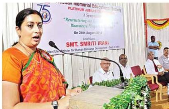
Smriti Irani speaking at the symposium in Hyderabad

She urged the experts from science and engineering, humanity backgrounds to help formulate new educa-