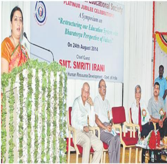
కేసీఎమ్మోరియల్ ఎడ్యుకేషనల్ సొసైటీ షాటిన్ల జూబ్లీ సెలబ్రేషన్లలో పాల్గొన్న కేంద్రమంత్రి స్మృతి ఇరానీ